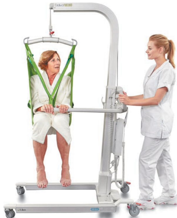
Golvo met grote wielen.