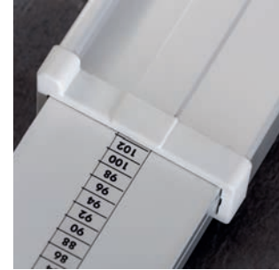
Parallele pootspreiding van minimaal 73,5 cm tot maximaal 102 cm.*