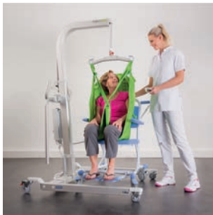
Transfers van bed naar rolstoel / douche-toiletstoel of brancard.