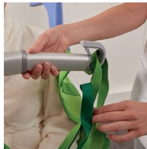
Veilige bevestiging van de tilband.