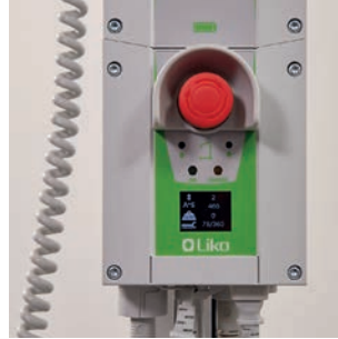
Accu-indicatie met intelligente controlbox.