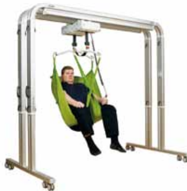
Freespan Traverse Ultra Twin Freespan Traverse