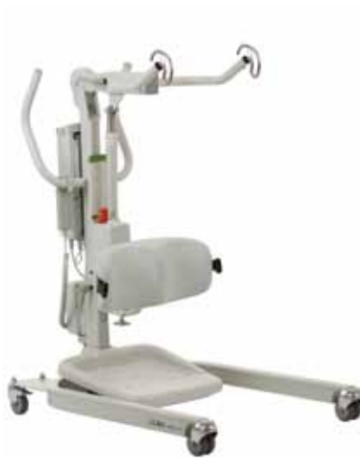
Sabina II EE