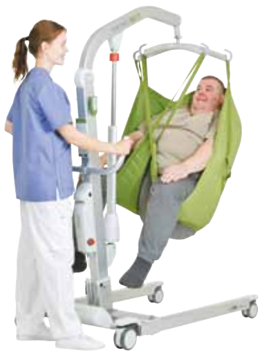
Viking L Viking XL