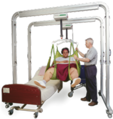
Freespan Ultra Twin Freespan