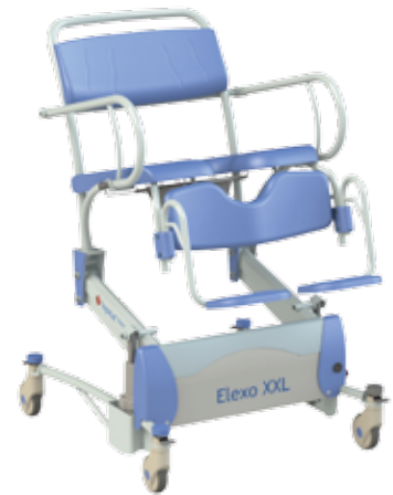
Elexo Elexo XXL