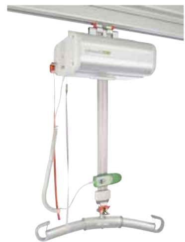
Likorall 200 Likorall 243 Likorall 250